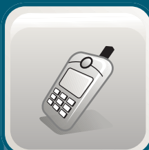
Steuerung per Handy