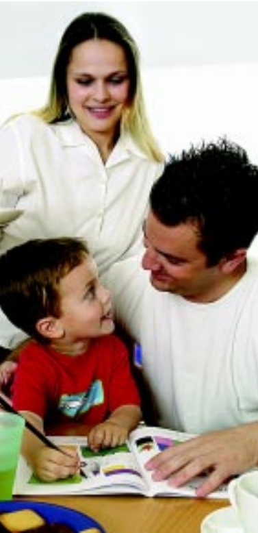
Sicherheit im und ums Haus

Sintony SI80 ist das kabellose Sicherheitssystem von Siemens. Kaum eine andere Einbruchmeldeanlage erfüllt die Anforderungen an einfache Bedienung, hohe Benutzerfreundlichkeit und umfassende Sicherheit so konsequent wie die neue Sintony SI80.