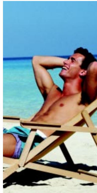
Einschalten und einfach abschalten

Für bessere Übersicht, mehr Sicherheit und Komfort.