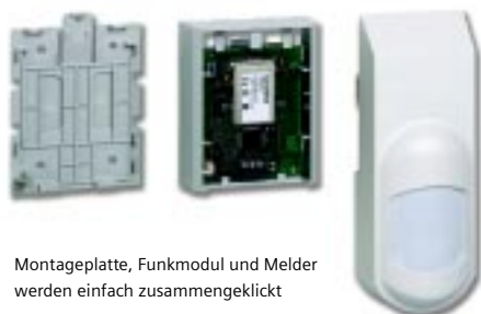
Montageplatte, Funkmodul und Melder werden einfach zusammengekllickt

Die Anlage wird ebenso einfach konfiguriert: schon ist sie einsatzbereit.