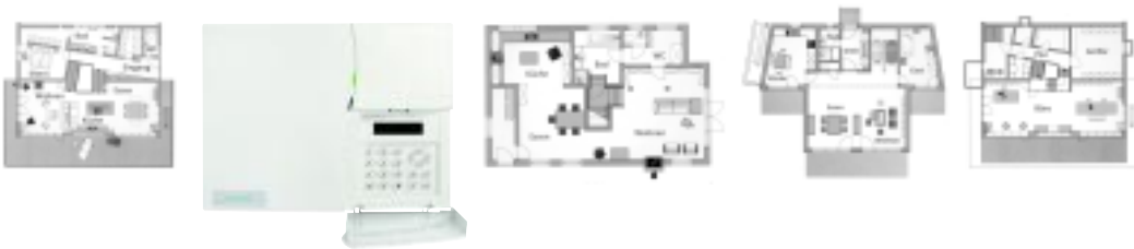
Ideal für das Haus, die Wohnung und das Büro