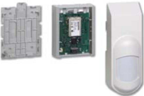
Montageplatte, Funkteil und Detektor werden einfach zusammengeklickt.

Das neue elektromechanische Konzept von SiRoute™ garantiert einfache Installation. Die Melder werden ohne Dübel montiert. Die universelle Montageplatte wird an der Wand oder Decke befestigt, wobei je nach Untergrund verschiedene Montagearten in Frage kommen (Schrauben, Kleben). Schliesslich wird erst das Funkteil, dann der Melder an der Montageplatte eingeklickt. Und fertig ist die Installation.